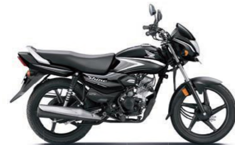
ग्रे के साथ ब्लैक

अभी ऑनलाइन बुक करें! www.honda2wheelerindia.com