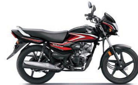
रेड के साथ ब्लैक