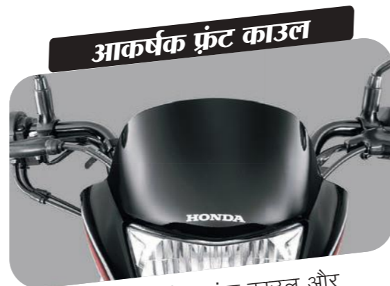
आकर्षक फ्रंट काउल

टैंक के साथ साइड ग्राफिक्स की खूबसूरती बढ़ाए आपकी शान।