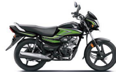
ग्रीन के साथ ब्लैक