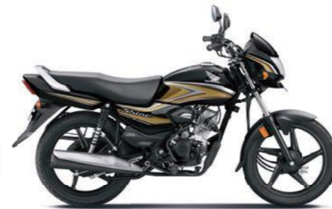
गोल्ड के साथ ब्लैक