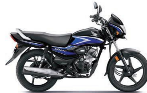
ब्लू के साथ ब्लैक